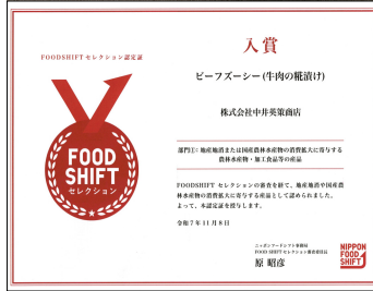
農水省フードシフト入賞状

前号既報の通り、農水省が主宰となつて、我が国の食料自給率向上を目指して立ち上げた「日本フードシフト」プロジェクト主催事業の一貫